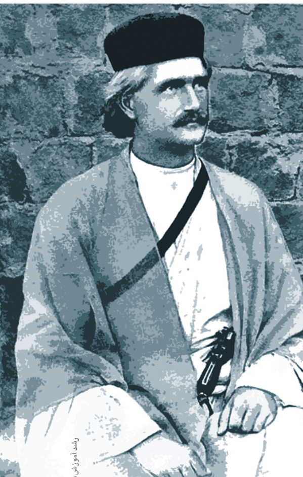
واسموس در لباس تنگستانی‌ها