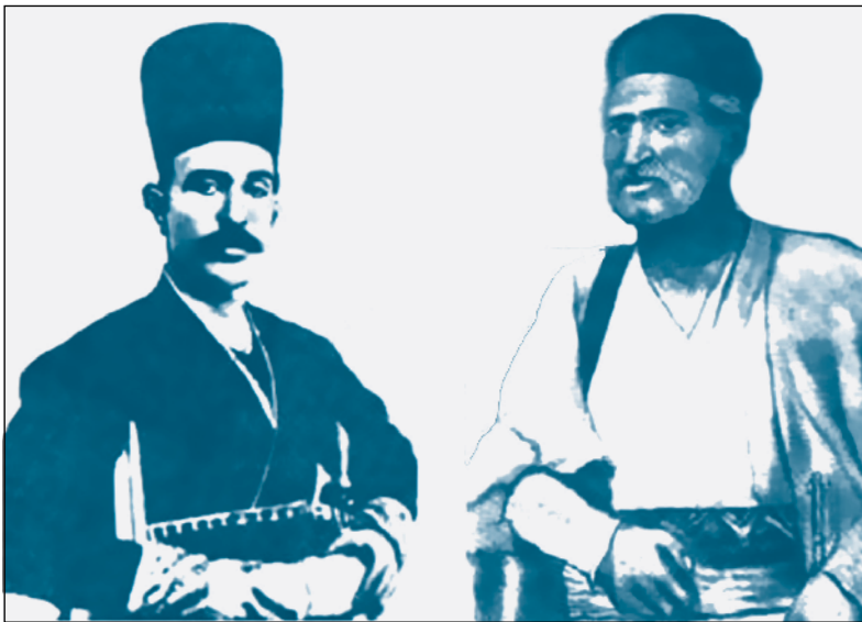
از راست: شیخ حسین خان چاکوتاهی و غضنفر السلطنه برازجانی

به وسیله جاسوسان خود مطلع شدند که شیخ حسین خان و زائر خضرخان به ترمیم قوا مشغول اند، بنابراین در روز اول ربیع الثانی ۱۳۳۸ هـ. ق/ ۱۹۱۹ م. کلنل میجرتریو قائم مقام کنسولگری دولت انگلیس در بوشهر، اعلامیه‌ای علیه این دو منتشر کرد که از مطالعه اعلامیه می‌توان به عمق خشم و نفرت اجانب نسبت به سران مجاهدین پی برد. ۴۲ زائر خضرخان که از پانزده سالگی با شکست دادن نیروهای انگلیسی در نبرد ماهور کلاتک ۴۳ ، همچنین شکست دادن نیروهای متحد انگلیسی، حسن خان تنگستانی و احمدخان دریا بیگی، حاکم بوشهر - که از پشتیبانی هواپیماهای انگلیسی در حمله به خائیز برخوردار بودند - در سه مرحله توانست نیروهای انگلیسی را وادار به عقب‌نشینی نماید و قوای انگلیسی نتوانستند مقاومت او را در هم شکنند. در این ماجرا، حسن خان تنگستانی که در اهرم در نبرد باغک با زائر خضرخان زخمی شده بود در بوشهر درگذشت. بدین ترتیب چون در یابگی دیگر نتوانست رقیب قدرتمندی را در مقابل زائر خضرخان در منطقه تنگستان دست و پا کند، زائر خضرخان دوباره به قلعه خود بازگشت. ۴۴